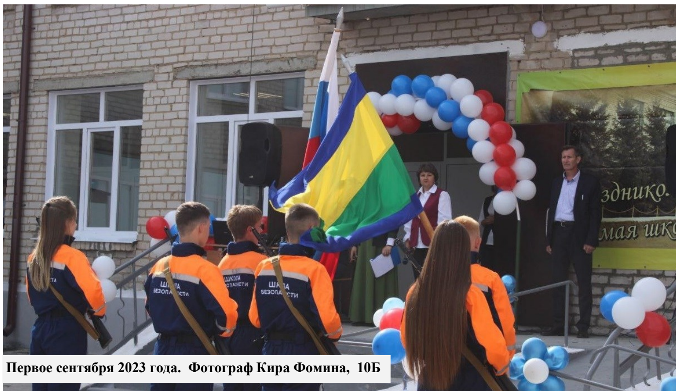
Первое сентября 2023 года.