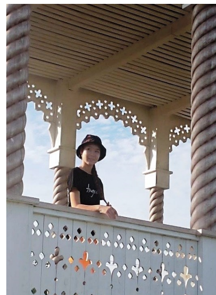
Территория Бутинского дворца

Это путешествие было интересным. Я не жалею, что увидела новые места, познакомилась с новыми людьми, за короткий срок узнала много нового о своём крае.