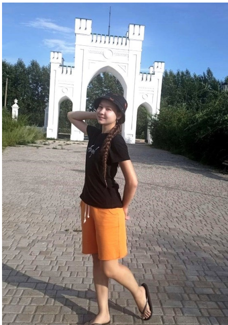
Территория Бутинского дворца