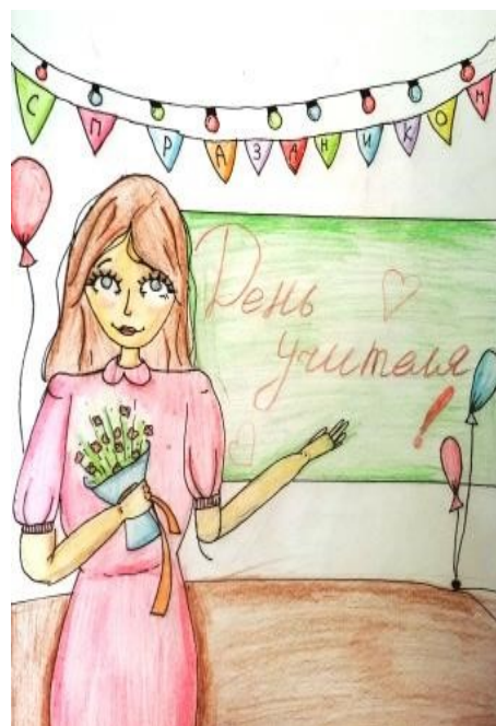
Художник Кузьмина Дарья, 6Б

В 1978 году занятия начались в новом трёхэтажном здании школы, в котором продолжается учебный процесс и по настоящее время.