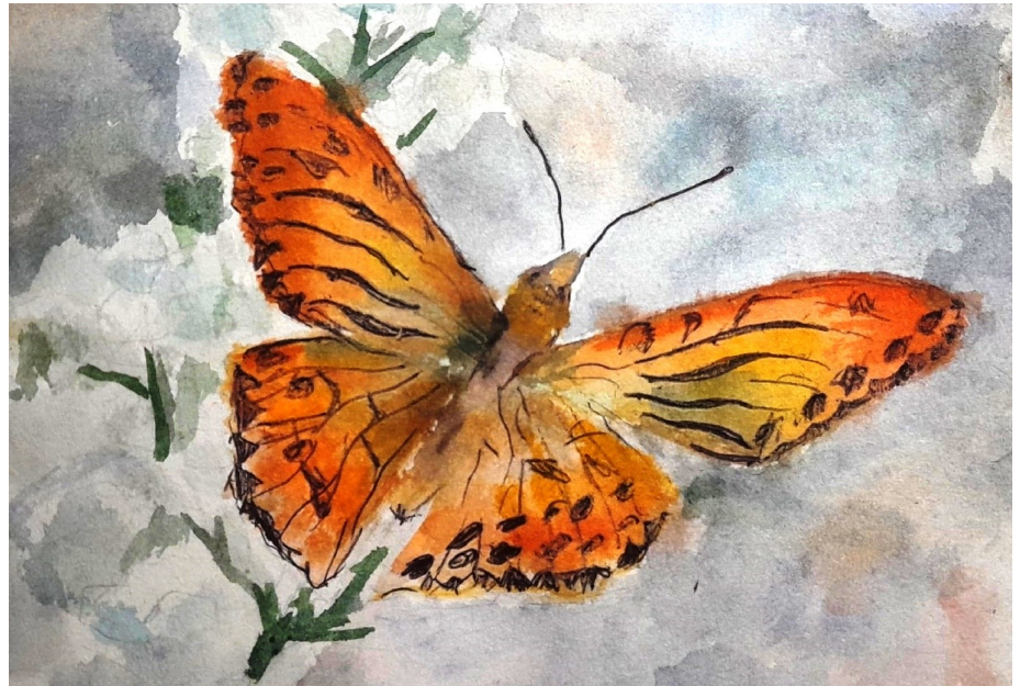
Рисунок Варвары Болтриной, 9А

З наете ли вы, что учебный год не всегда начинался 1 сентября? Ещё при Петре Первом сельские школы открывали свои двери первого декабря. Это связано с тем, что многие ученики были заняты сельскохозяйственными работами.