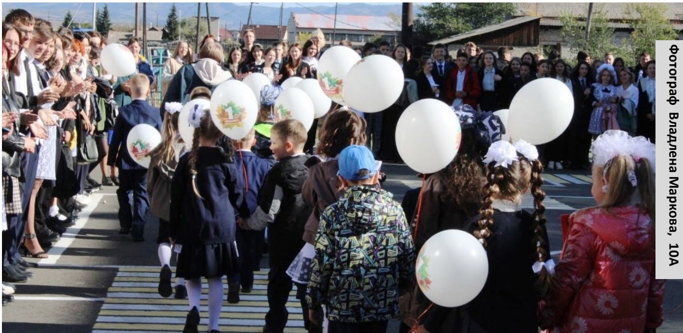
Фотограф Владлена Маркова, 10А

Первого сентября в Улётовской средней школе сел за парты 891 ученик. Из них 87 первоклассников в 4-х классах, 101 пятиклассник (5 классов) и 34 будущих выпускника (2 класса).