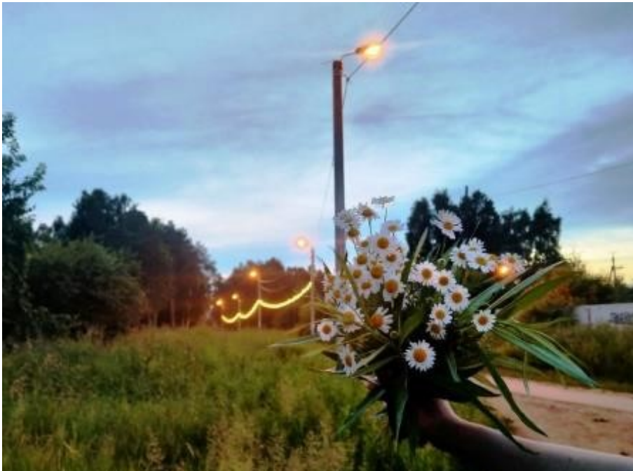
Фотограф Валерия Рябоконт, 9Б