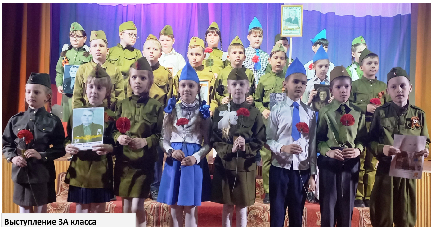
Выступление 3А класса