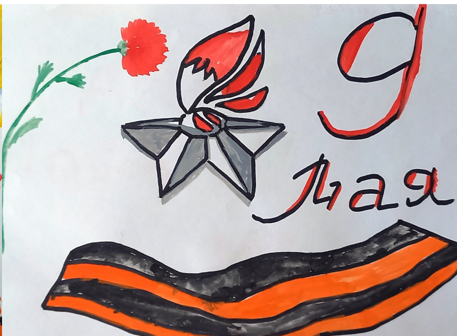
Художник Савелий Мигунов, 2А