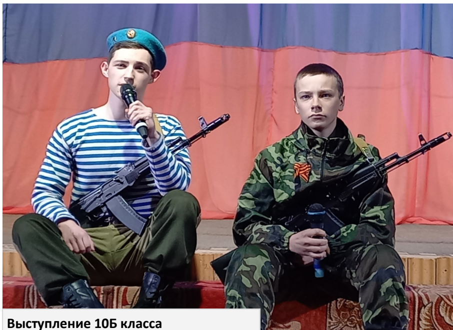
Выступление 10Б класса

В конкурсе два этапа. Сначала все участники проходят отборочный тур,