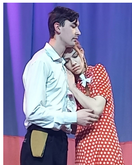
Выступление 11Б класса

войны фашистская Германия атаковала границы Советского Союза. В 4 часа утра началась самая кровопролитная война в истории человечества. Сама страшная, внезапная, беспощадная. Трудно теперь представить дороги отступления, концлагеря, блокадный Ленинград—прозрачные лица, осьмушку хлеба... Песня «Это просто война..» прозвучала в исполнении учащихся 6А класса.