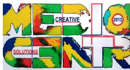
Эмблема медиацентра "ШОК"

2. Миссия: создание условий для разностороннего творческого роста учащихся, приобретения актуальных навыков и умений, необходимых специалисту в сфере современных медиа (печатные, видео-, аудио-, интернет).