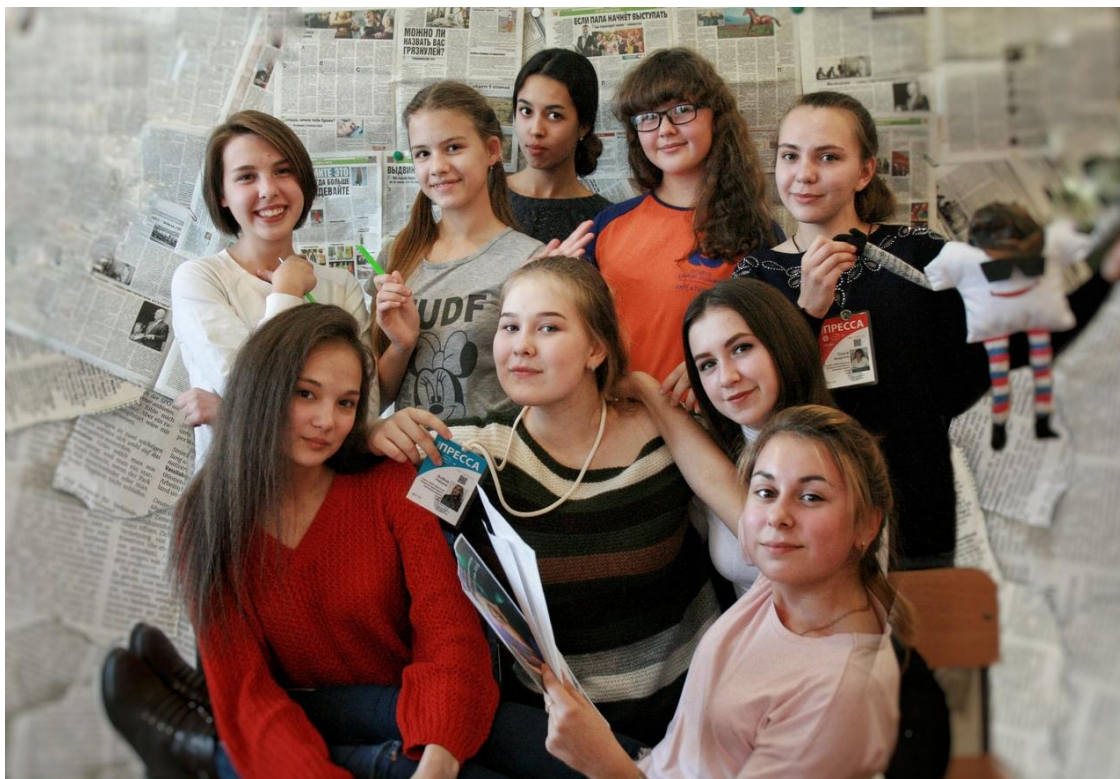
Пресс-центр "ШОК", сентябрь 2018 года