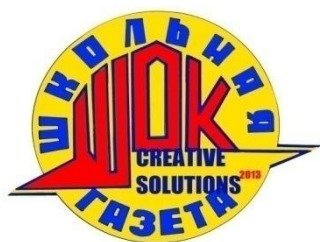
Эмблема газеты "ШОК"