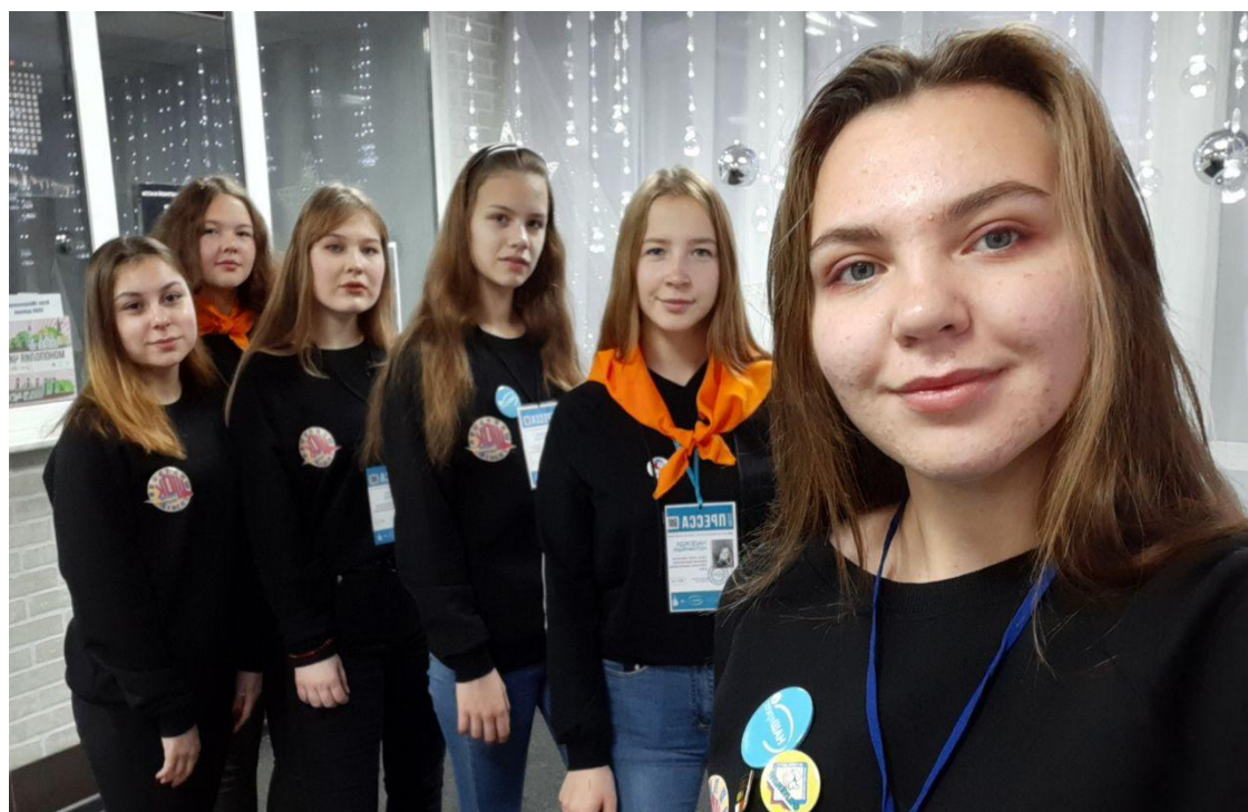
Медиацентр "ШОК", ноябрь 2019 года. "Мегаполис"